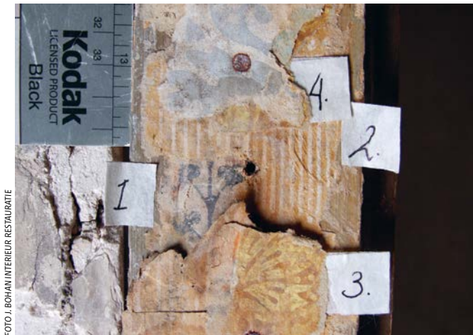
INTERIEUR RESTAURATIE