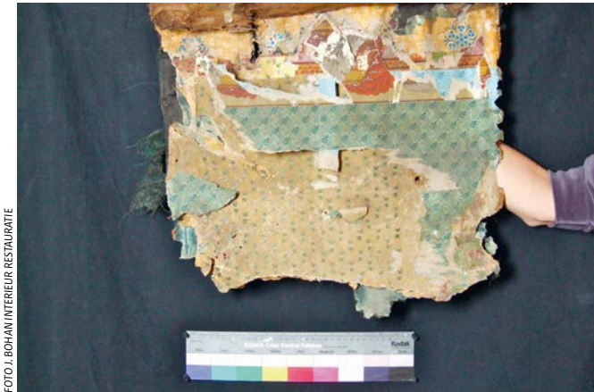
INTERIEUR RESTAURATIE